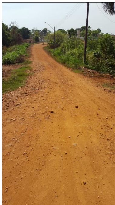
Figura 1 - Inserir localização da via

A relação fotográfica encontra-se a seguir: